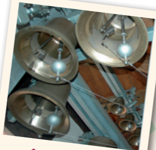
Bronzeglocken des Carillons

Sie möchten dieses in der Rhön einzigartige Instrument ebenfalls hören? Dann lauschen Sie dem Audio-File in Geisa.