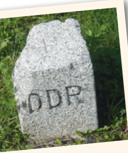
Grenzstein der DDR