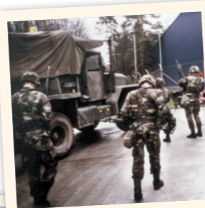
US-Soldaten an der Grenze