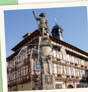
Rathaus in Vacha

Im Werratal, direkt in Nachbarschaft zur Rhön und dem Thüringer Wald, liegen die ehemalige Grenzstadt Stadt Vacha und die historische Burg Wendelstein. Vielseitige kulturelle Veranstaltungen und die reizvolle Umgebung machen die Stadt attraktiv und laden zu einem Besuch ein.