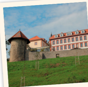
Blick auf Geisa

Zu DDR-Zeiten war Geisa die am weitesten westlich gelegene Stadt des Ostblocks und lag mitten im Sperrgebiet. Wie sich das Leben an der Grenze im Laufe ihres Bestehens entwickelte und die nahe bei Geisa stationierten Amerikaner die Stadt sahen, erfahren Sie am Standpunkt in Geisa.