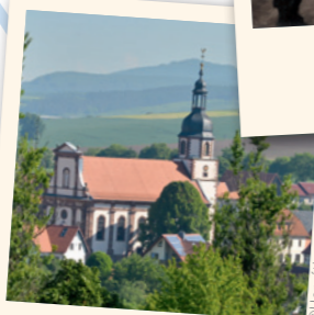
Dorfkirche „Maria Schnee“

Nachdem sich Schleid jahrzehntelang im Sperrgebiet befand und für Touristen unzugänglich war, kann heute die barocke Dorfkirche „Maria Schnee“ wieder besichtigt werden. Nach der Patronin der Pfarrkirche ist das „Schneefest“ benannt, welches seinen Ursprung zu Zeiten des Dreißigjährigen Krieges hat. Wie und warum das regional bekannte Fest heute noch gefeiert wird und sich das kirchliche Leben im Grenzgebiet zu Zeiten des SED-Regimes gestaltete, erfahren Sie am Standort Schleid.