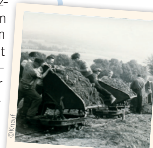
Die weißen Berge entstehen

Der ehemalige Grenzort Unterbreizbach mit rund 3.600 Einwohnern lebt seit Jahrzehnten mit und vom Kali-Bergbau, der die Region seit über 100 Jahren prägt. Ihm verdankt auch der nahe gelegene der Monte Kali seine Entstehung. Woraus der weiße Berge besteht und warum er täglich größer wird, erfahren Sie am Standort.